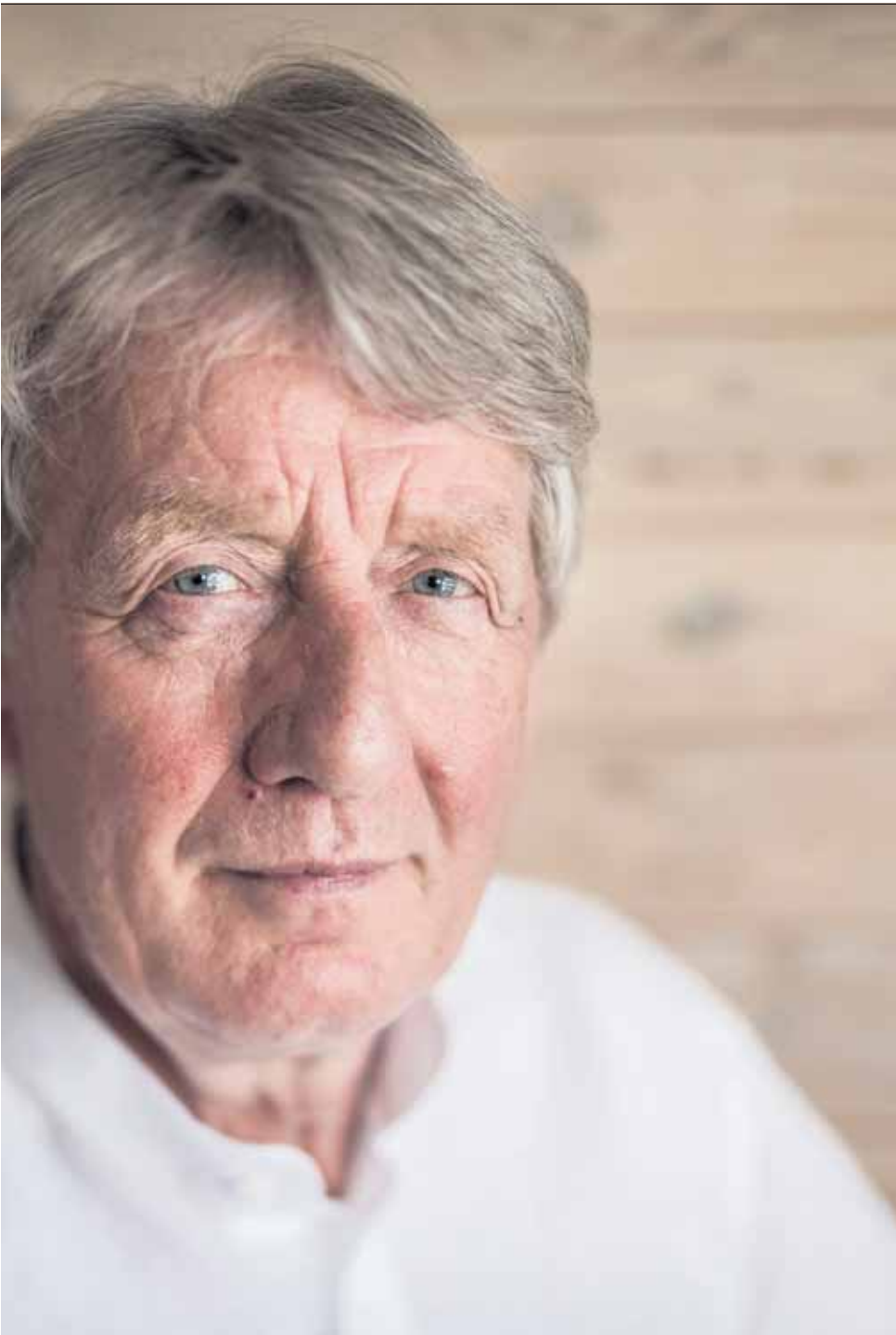
eget klasserom. Det har kostet ham dyrt å ta et offentlig oppgjør med skolens manglende innsats mot vold.